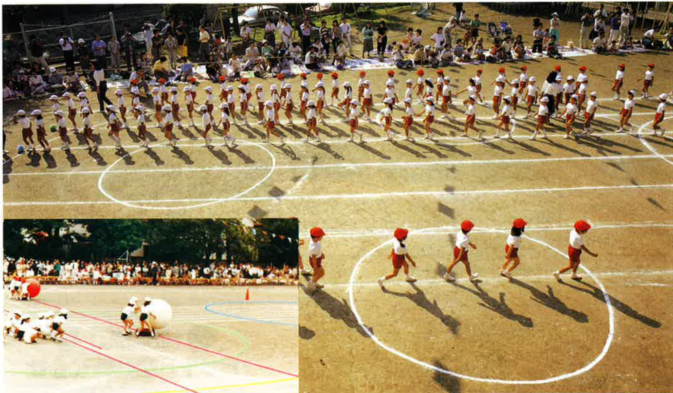
ライン引きがスムーズ